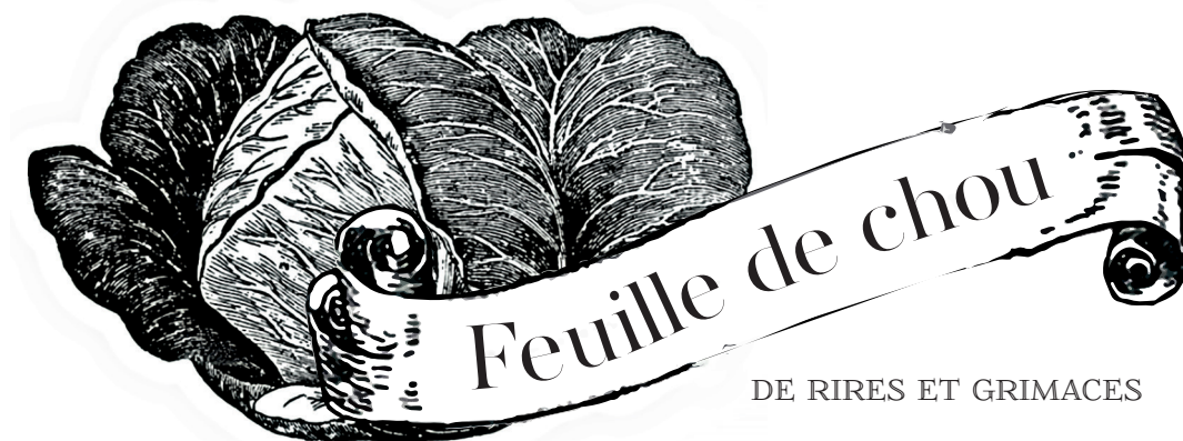
DE RIRES ET GRIMACES